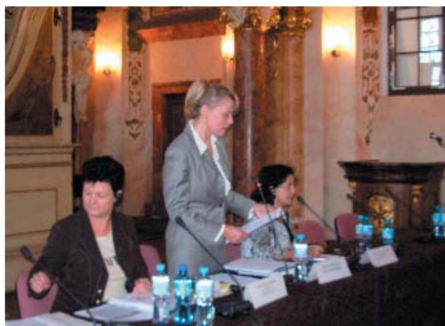
Sala Oratorium Marianum Uniwersytetu Wrocławskiego.

Uczestnicy konferencji podpisali rezolucję w sprawie „Europejskiego roku 2007 „Równych Szans dla Wszystkich”. W rezolucji czytamy między innymi: „Popieramy inicjatywę Komisji Europejskiej, dotyczącą kwestii równości i przeciwdziałania dyskryminacji. Mamy nadzieję, że to działanie nie ograniczy się jedynie do tworzenia unijnych dokumentów. Oczekujemy, iż kraje członkowskie, szczególnie Polska, będą wdrażać i egzekwować przepisy wspólnotowe, gdyż nadal niska świadomość społeczna powoduje zachowania i postawy dyskryminujące mniejszości. Istotnym krokiem, zmierzającym do naprawienia istniejącego stanu rzeczy w Polsce, będzie opracowanie Krajowego Programu Obchodów „Europejskiego Roku 2007 Równych szans dla wszystkich”.