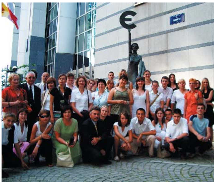
Bruksela – lipiec 2006. Grupa „Dolnoślązacy XII”.