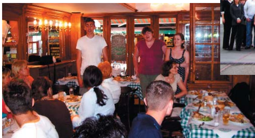
Bruksela – lipiec 2006. Grupa „Dolnoślązacy XII”.