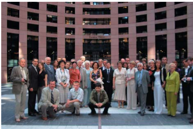
Strasburg – czerwiec 2006. Grupa „Dolnoślązacy XI”.