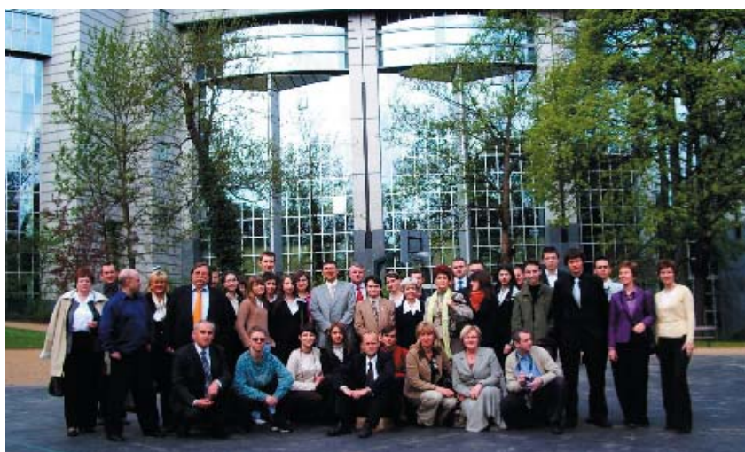
Bruksela – maj 2006. Grupa „Dolnoślązacy X”.

Dla wszystkich uczestników wizyt wielkim przeżyciem jest możliwość odwiedzenia siedzib Parlamentu Europejskiego w Brukseli i Strasburgu, szansa przysłuchiwania się obradom, spotkania z europarlamentarzystami, poznanie struktury i zasad działania organów UE.