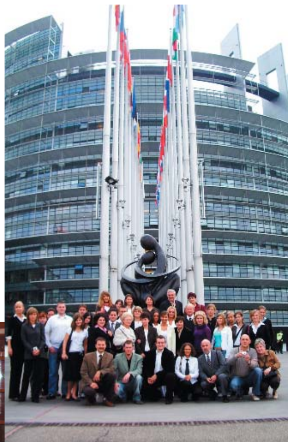
Strasburg – wrzesień 2006. Grupa „Dolnoślązacy XIII”.