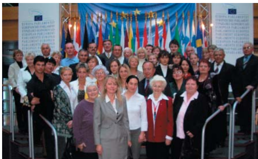
Strasburg – październik 2006. Grupa „Dolnoślązacy XIV”.

Wszyscy uczestnicy wyjazdów parlamentarnych zgodnie podkreślają, że dzięki zaproszeniu przez eurodeputowaną Lidię Geringer de Oedenberg, poznają zasady działania Europarlamentu oraz obserwują jak powstaje najnowsza historia wspólczesnej Europy.