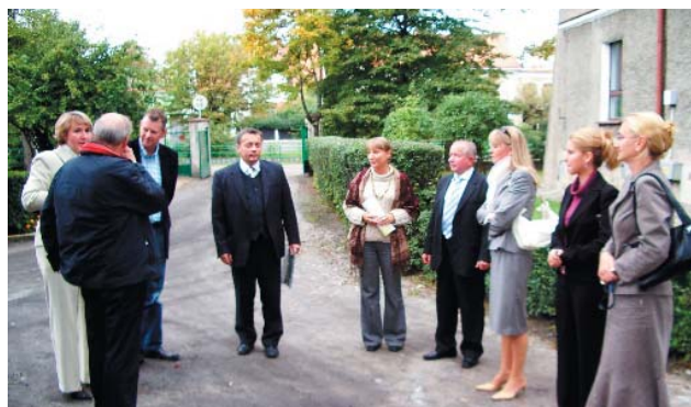
Lidia Geringer de Oedenberg oraz delegacja z Holandii podczas prezentacji Pałacu Sandreckich w Bielawie, w którym mieści się Specjalny Ośrodek Szkolno Wychowawczy.

Holendrzy odwiedzili Dzierżoniów, Lwówek Śląski, Zgorzelec, spotkali się również z przedstawicielami Urzędu Marszałkowskiego Województwa Dolnośląskiego i Opolskiego oraz Urzędu Miejskiego we Wrocławiu.