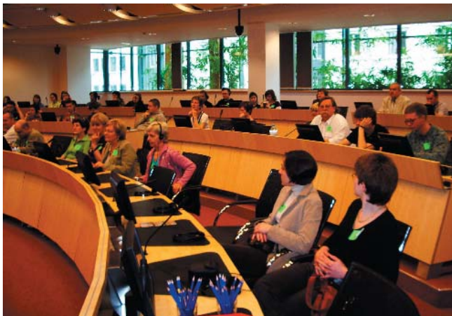
Bruksela – maj 2006. Grupa „Dolnoślązacy X”.