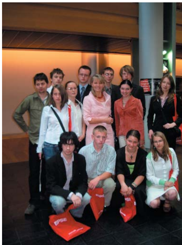
Strasburg – czerwiec 2006. Grupa „Dolnoślązacy XI”.