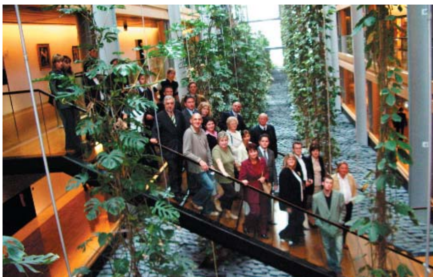
Strasburg – wrzesień 2006. Grupa „Dolnoślązacy XIII”.

Pragnę jeszcze raz podziękować Pani Posel w imieniu własnym i całej grupy zwiedzającej Parlament Europejski słowami Stanisława Staszica: „Każda rzecz ma być użyteczna, ma czemuś służyć”.